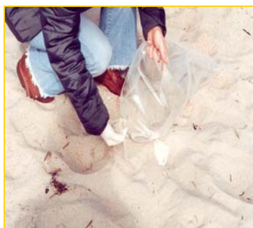
Ilustração 2: Colheita de uma amostra de areia

A colheita realiza-se em cada ponto a uma profundidade entre 5 e 15 cm, utilizando para o efeito, luvas estéreis e um saco esterilizado (ou nunca usado) únicos para cada praia (ilustração 2). Recolhem-se as amostras dos 3 pontos equidistantes no mesmo saco. Identifica-se o saco com o nome da praia , data e hora da recolha , conserva-se em frio (acumulador de frio doméstico ou frigorífico) e entrega-se no laboratório no prazo máximo de 24 horas , sempre sob refrigeração (inclusive durante transporte, em mala térmica ou veículo com refrigeração).